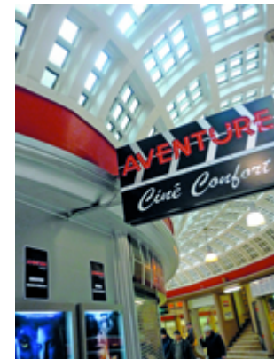
Enseigne: tout confort ...