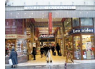
La galerie de la rue des Fripiers sera bientôt rénovée, elle aussi